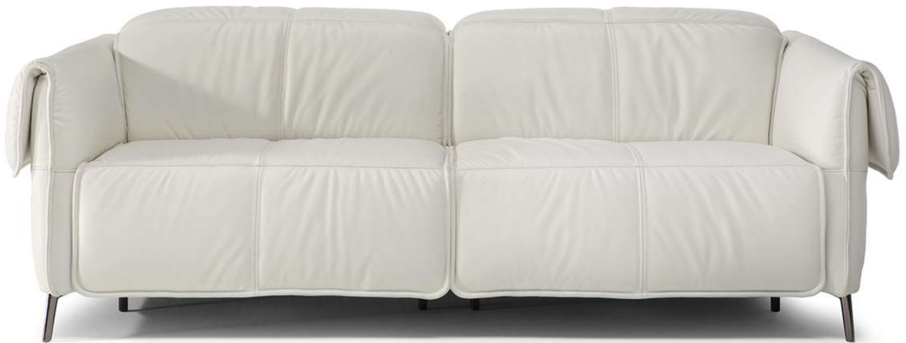
■ Vers. 450+452