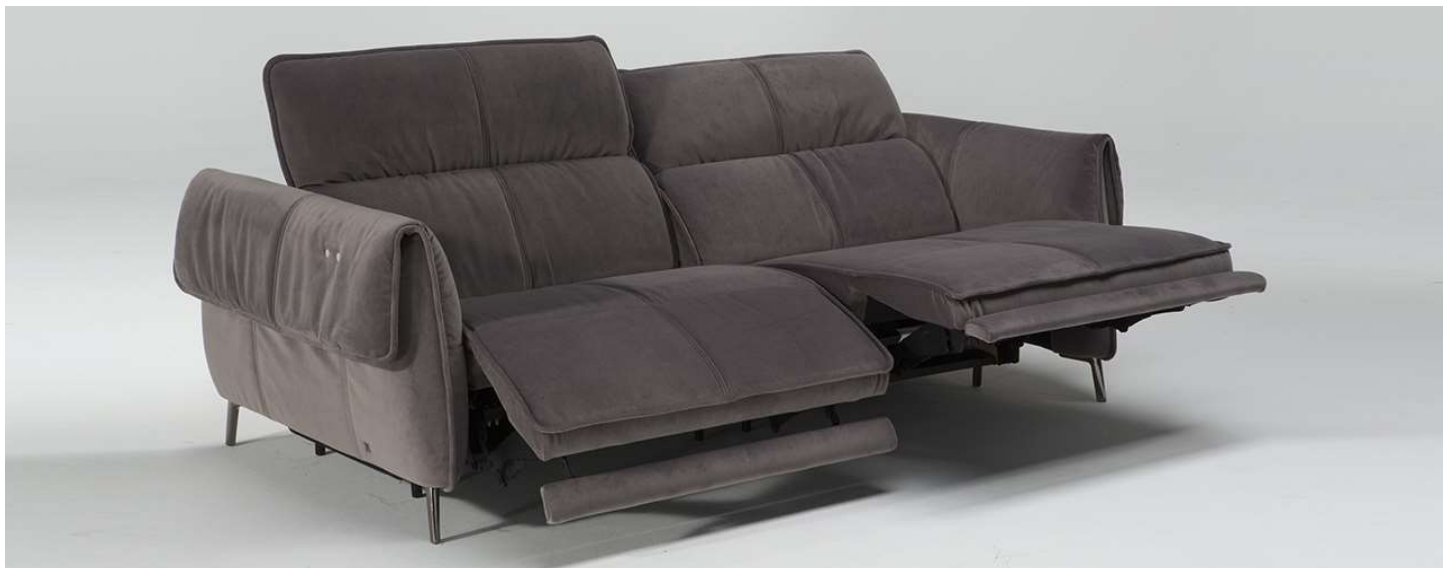
■ Vers. 450+452