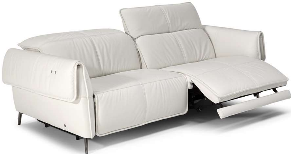
■ Vers. 450+452