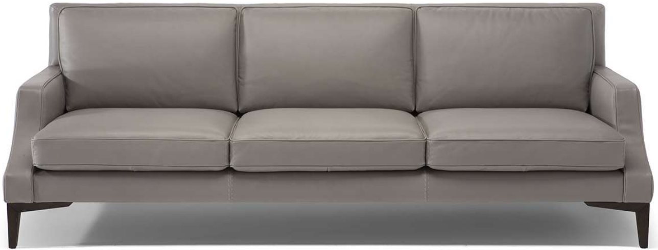
■ Vers. 064