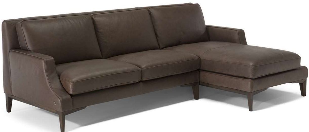
■ Vers. 016+049