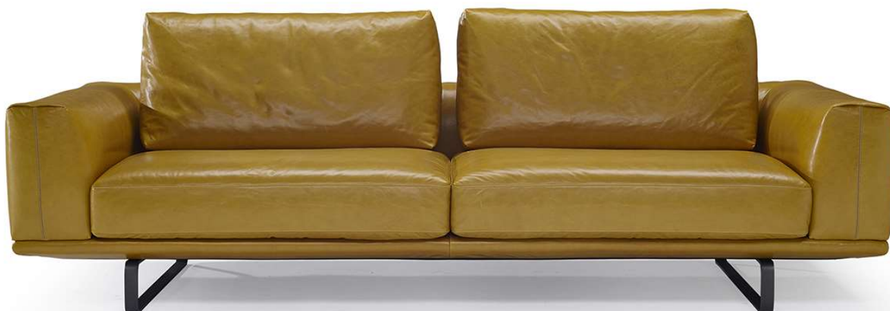
■ Vers. 009