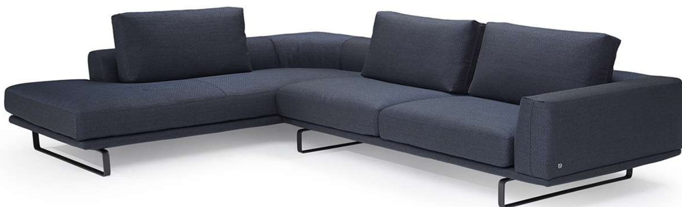
■ Vers. 200+019