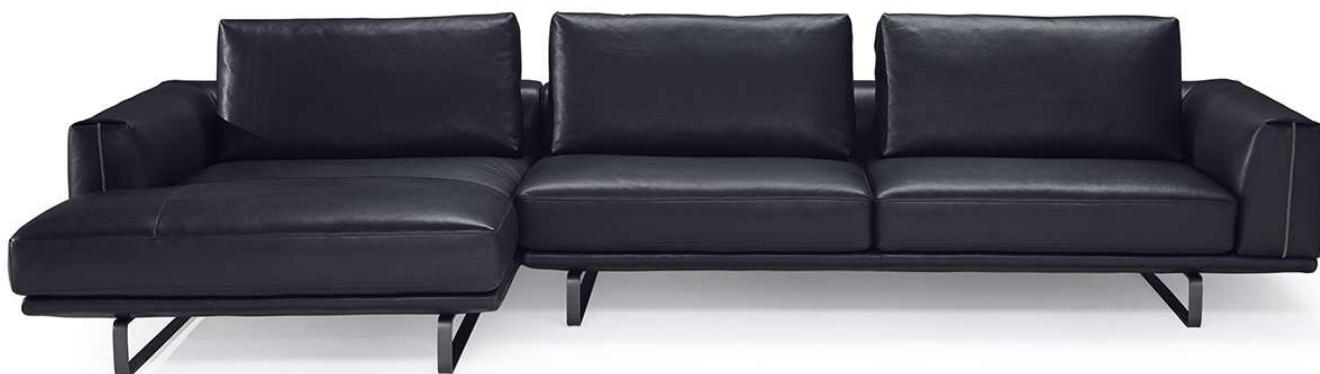
■ Vers. 277+019