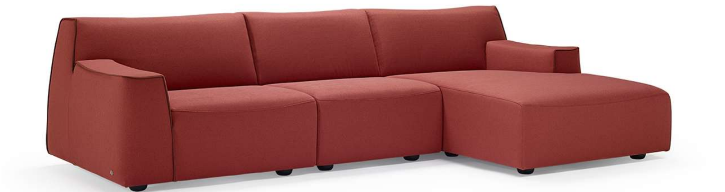
■ Vers. 000+001+049