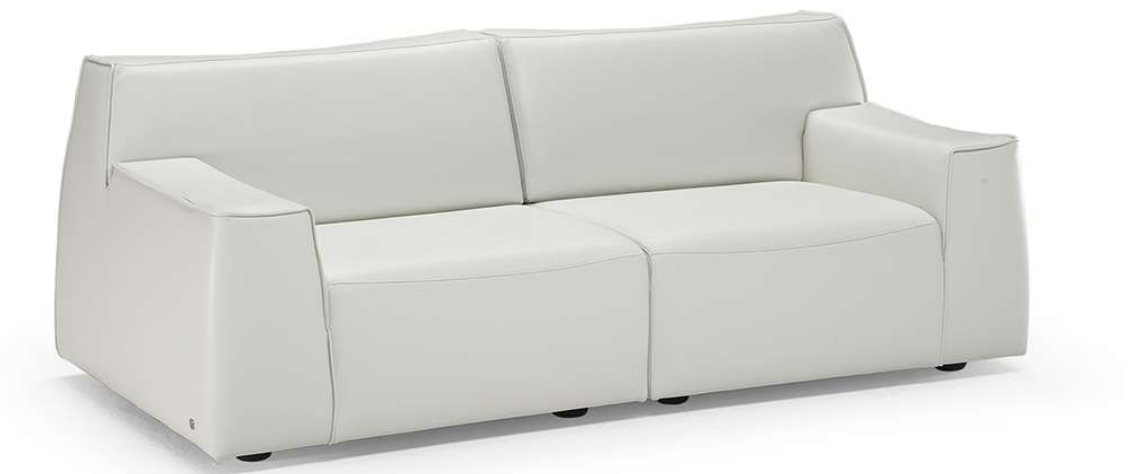
■ Vers. 000+002