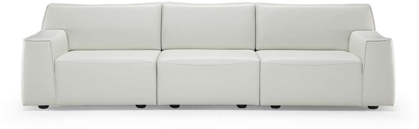
■ Vers. 000+001+002