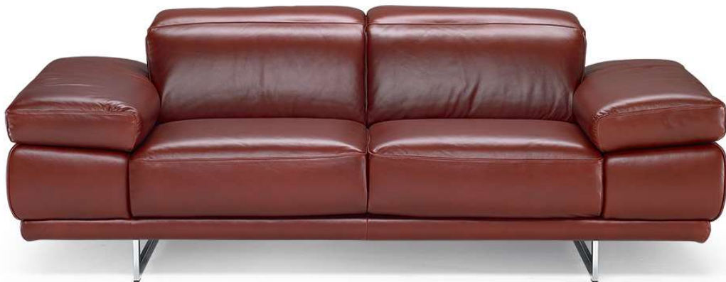
■ Vers. 005