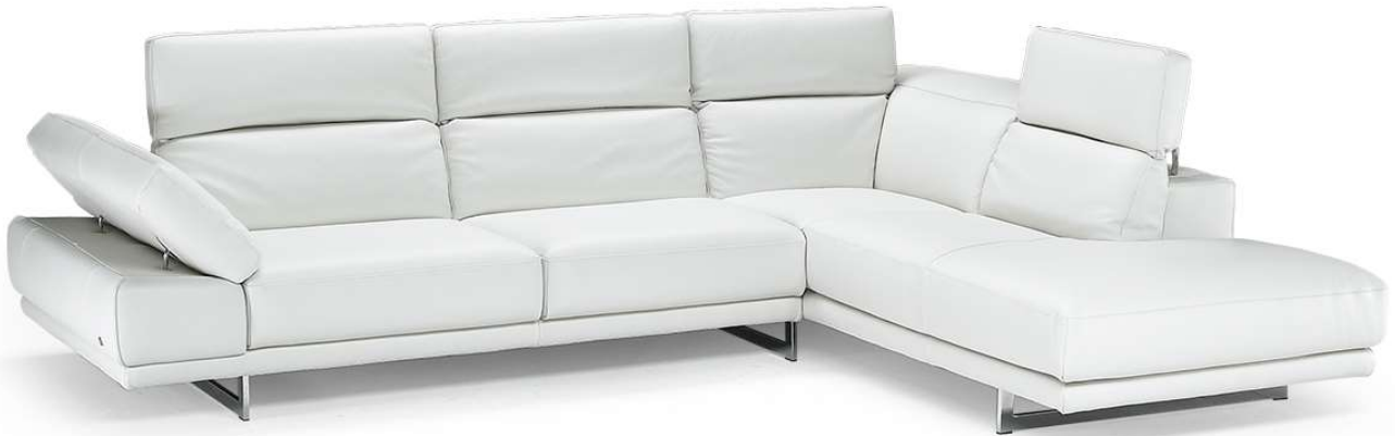
■ Vers. 018+481