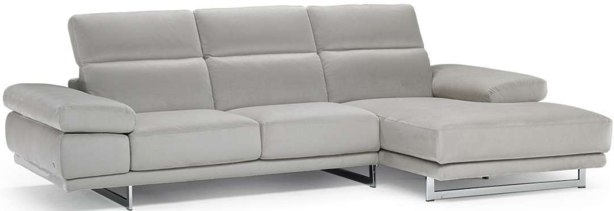
■ Vers. 016+049