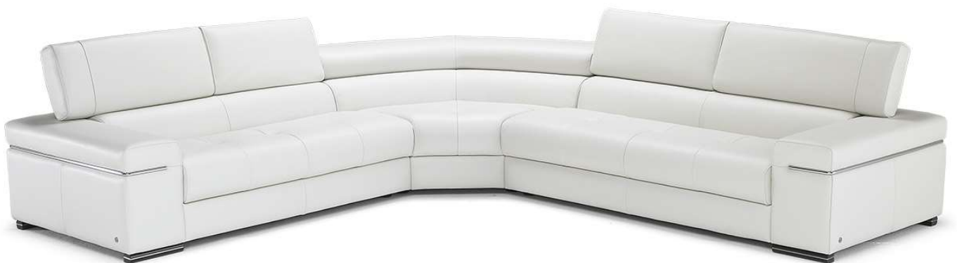
■ Vers. 016+076+217