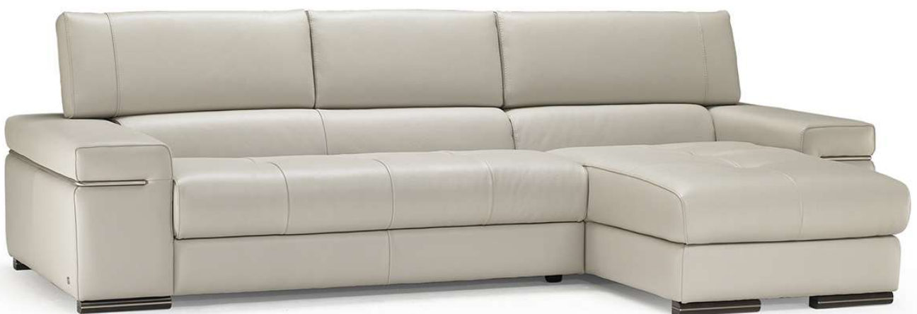
■ Vers. 016+049