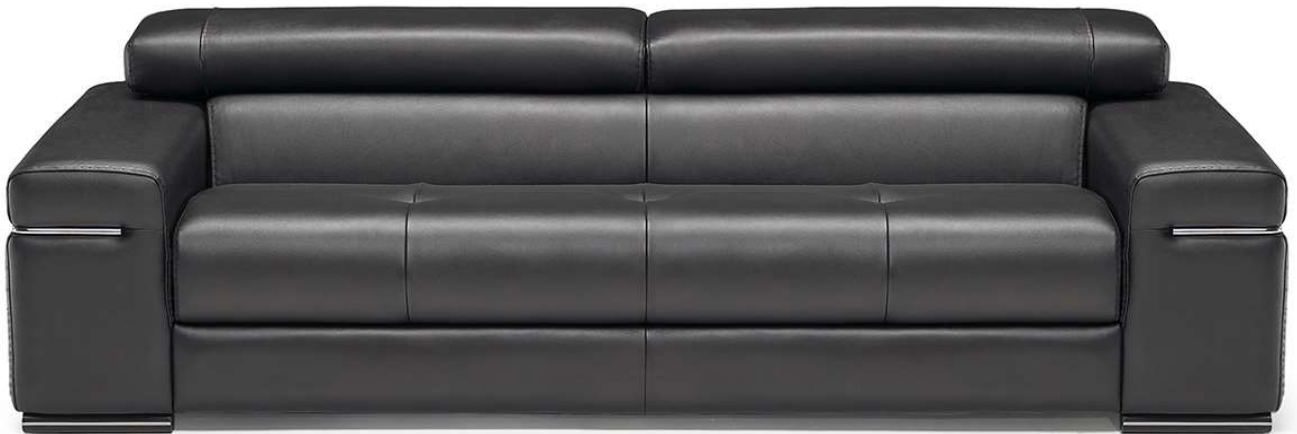
■ Vers. 009