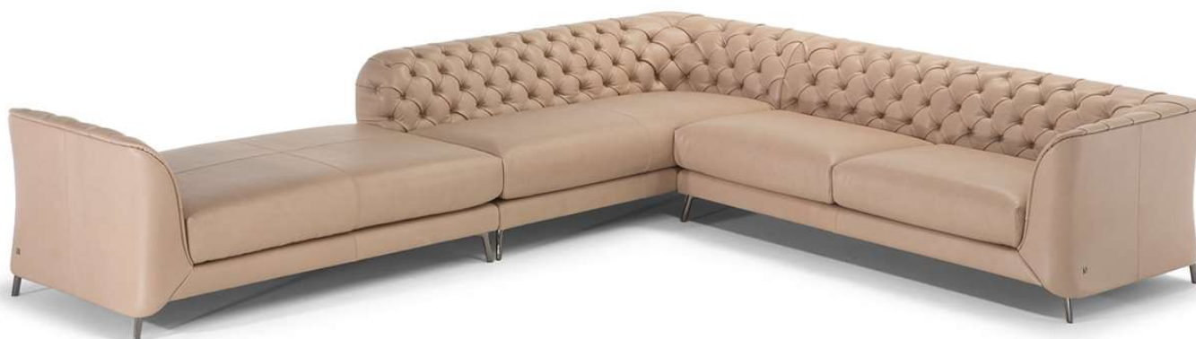
■ Vers. 212+220+019