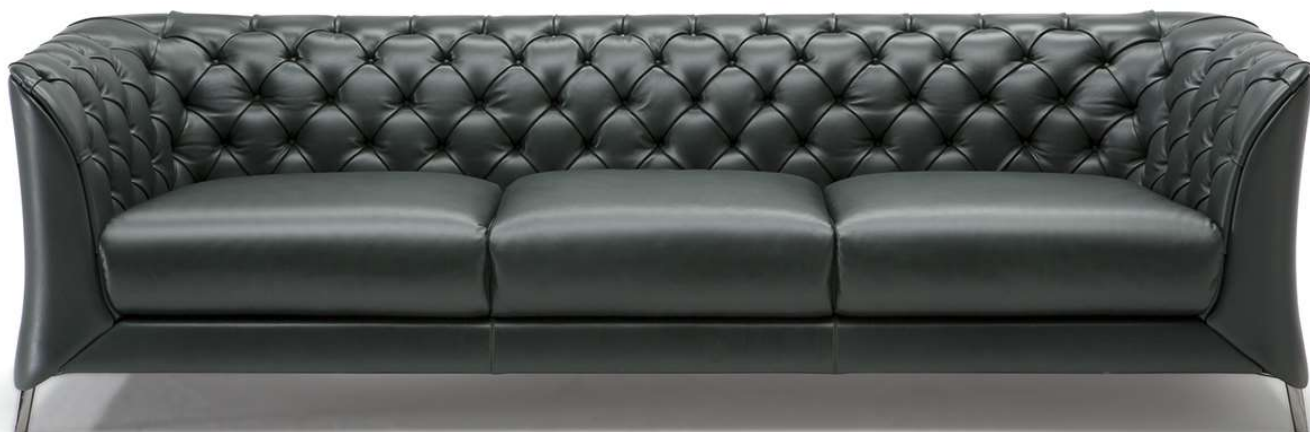
■ Vers. 064