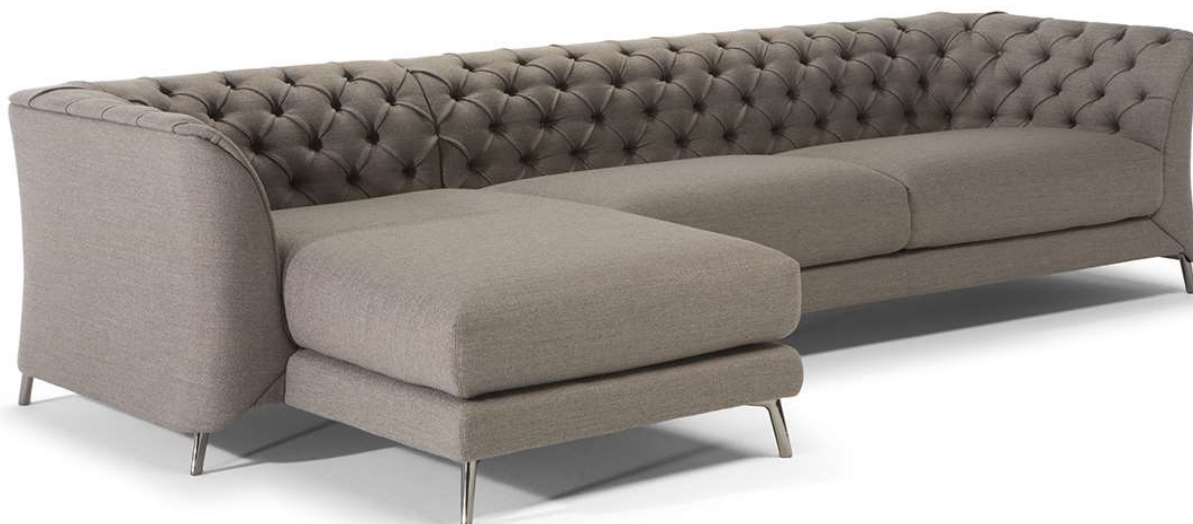
■ Vers. 047+019