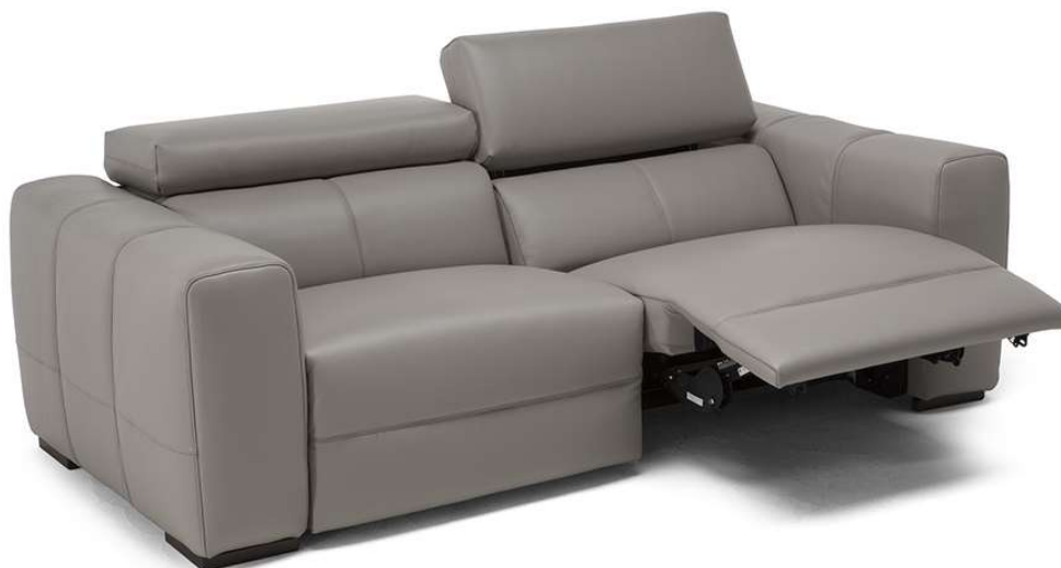
■ Vers. 446