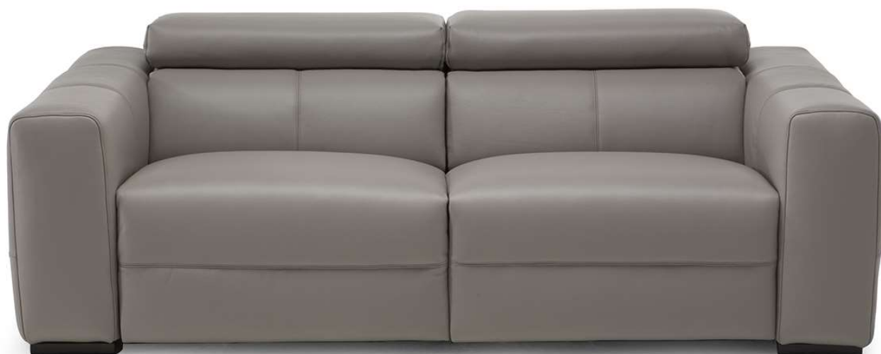
■ Vers. 446