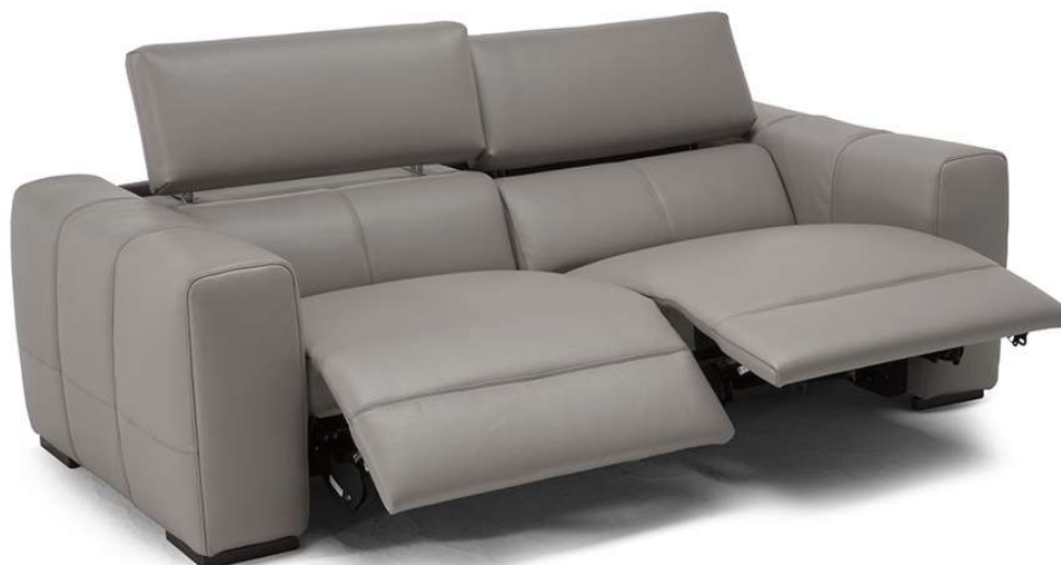
■ Vers. 446