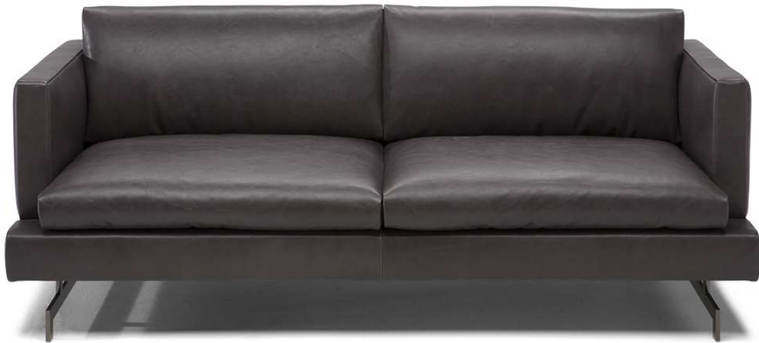
■ Vers. 009