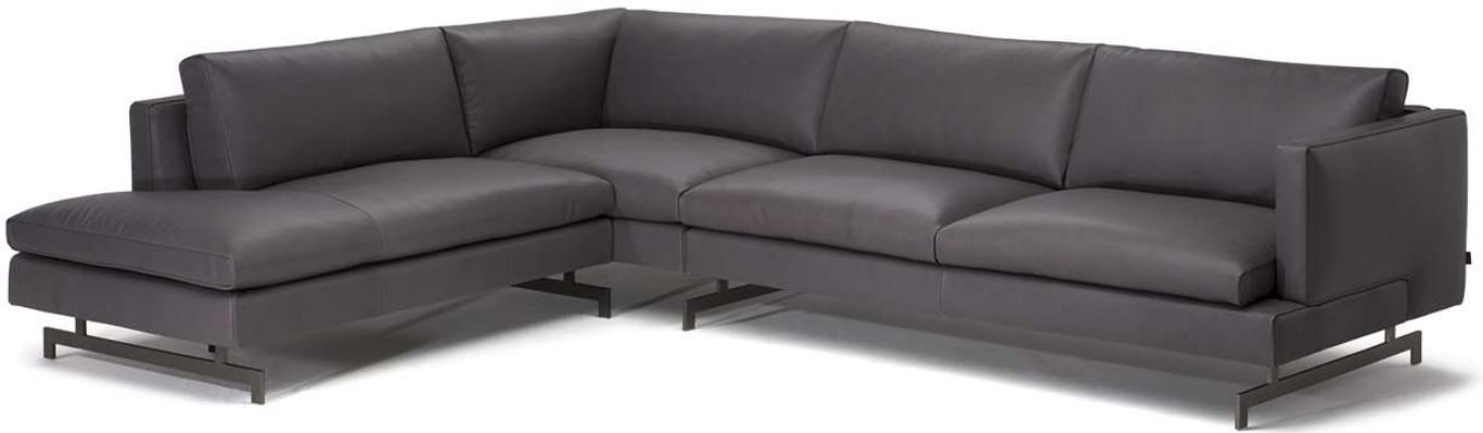
■ Vers. 072+032+019