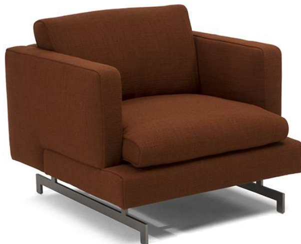
■ Vers. 003