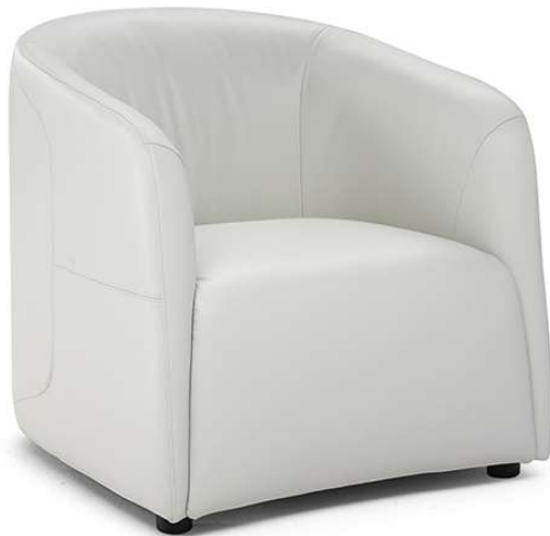
■ Vers. 003