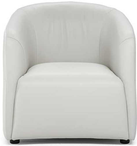
■ Vers. 003