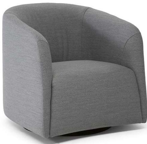
■ Vers. 003